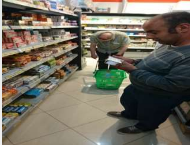
En el super