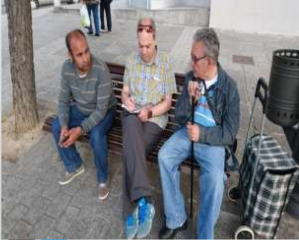
Haciendo la lista de la compra